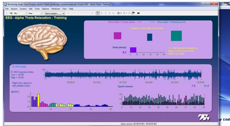
شکل ۲. نمای نمایشگر جلسه تمرین نوروفیدبک آلفا/تتا

ج) دستگاه نوروفیدبک، ابزاری است که امواج خام مغزی دریافت شده از طریق الکترودهای قرار گرفته بر روی سر را به فرکانس‌های امواج دلتا، تتا، آلفا و بتا تجزیه می‌کند. روش آموزشی نوروفیدبک با استفاده از دستگاه‌های مجهز به سیستم رایانه‌ای Procomp و نظارت محقق اجرا شد. این ابزار شامل سخت‌افزار BioGraph و نرم‌افزار شرکت Thought Technology Ltd بود. این دستگاه از جفت الکترودهایی تشکیل شده بود که بر طبق سیستم بین‌المللی ۲۰-۱۰ روی سر قرار گرفتند.