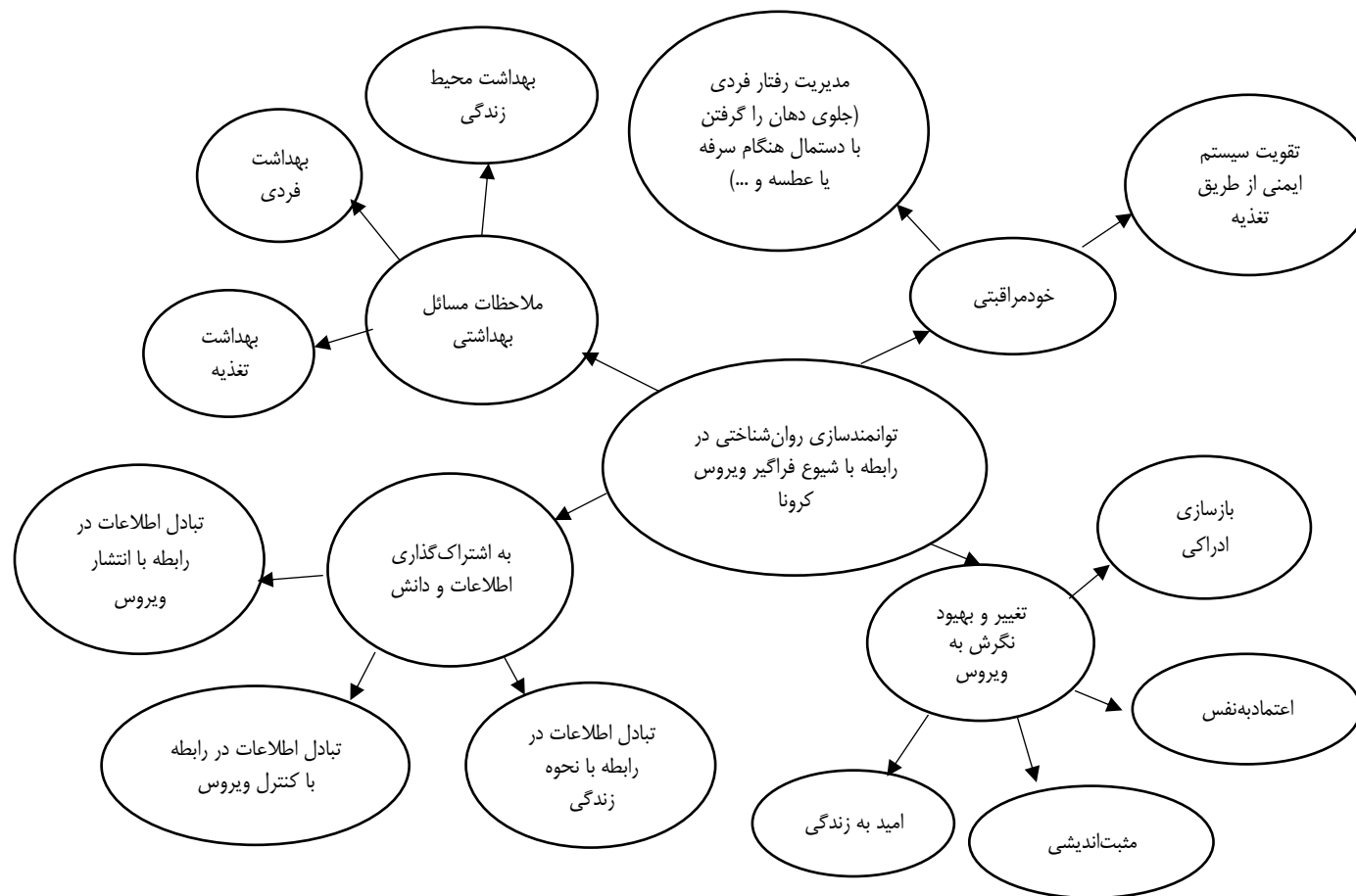
شکل ۱- الگوی تفسیری توانمندسازی روان‌شناختی فردی در رابطه مدیریت ویروس فراگیر کرونا